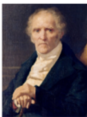
Charles Fourier (1772-1837)