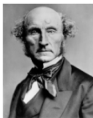
John Stuart Mill (1806-1873)