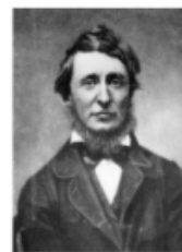
Henry David Thoreau (1817-1862)