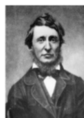
Henry David Thoreau (1817-1862)