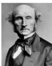
John Stuart Mill (1806-1873)