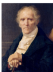
Charles Fourier (1772-1837)