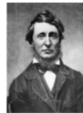
Henry David Thoreau (1817-1862)