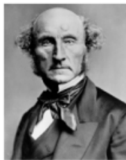
John Stuart Mill (1806-1873)