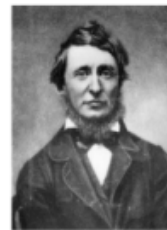
Henry David Thoreau (1817-1862)