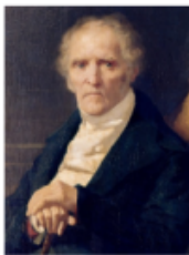
Charles Fourier (1772-1837)