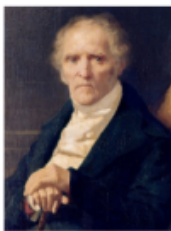
Charles Fourier (1772-1837)