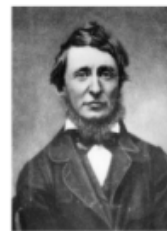
Henry David Thoreau (1817-1862)