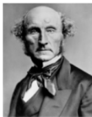
John Stuart Mill (1806-1873)