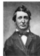
Henry David Thoreau (1817-1862)