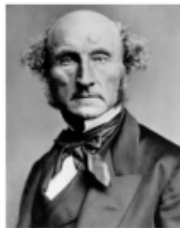
John Stuart Mill (1806-1873)