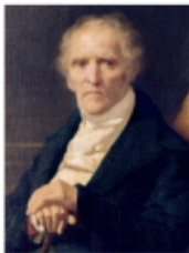
Charles Fourier (1772-1837)