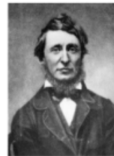
Henry David Thoreau (1817-1862)