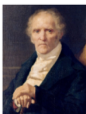
Charles Fourier (1772-1837)