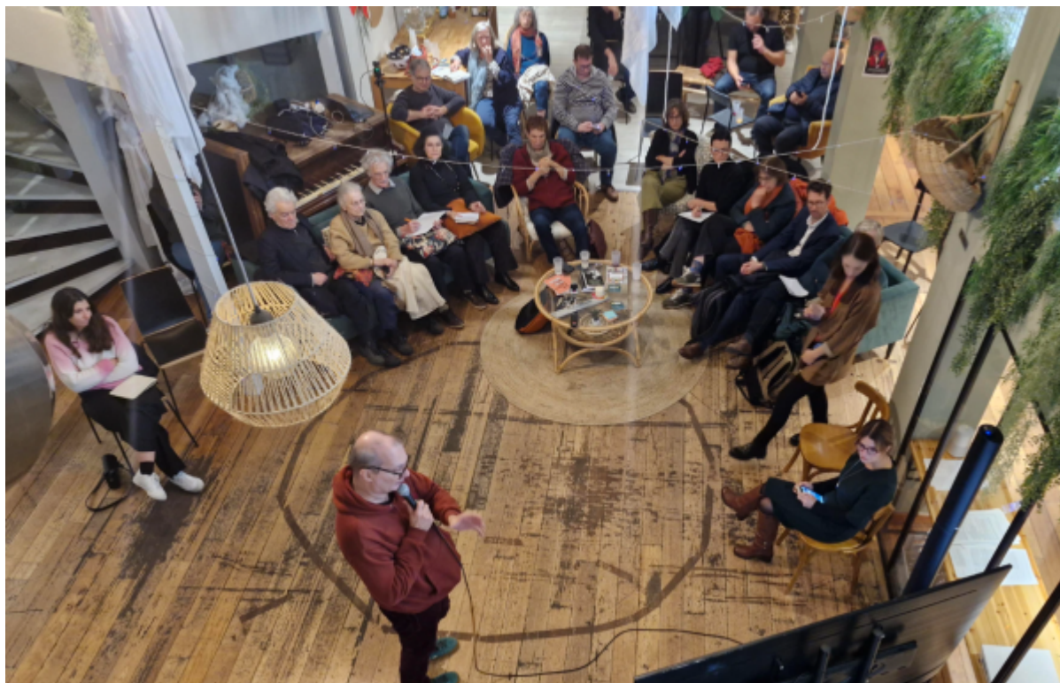
Photo d'ambiance de la soirée du 3 novembre à Malakoff en présence de David Cormand, dans les espaces de co-working de Bureaux & Co

Cette conférence-débat s'est tenue le lundi 3 novembre 2025 à l'initiative du groupe local Les Écologistes Malakoff.