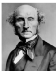
John Stuart Mill (1806-1873)