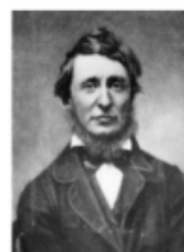
Henry David Thoreau (1817-1862)