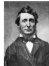
Henry David Thoreau (1817-1862)