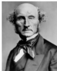
John Stuart Mill (1806-1873)