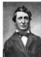
Henry David Thoreau (1817-1862)