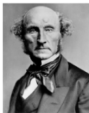
John Stuart Mill (1806-1873)