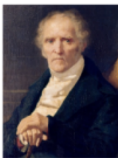
Charles Fourier (1772-1837)