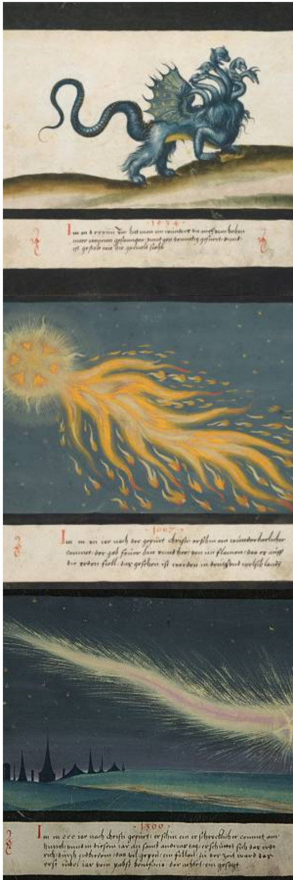
Voici toutes les illustrations de ce Livre des Miracles que j'ai pu glaner sur le Net...