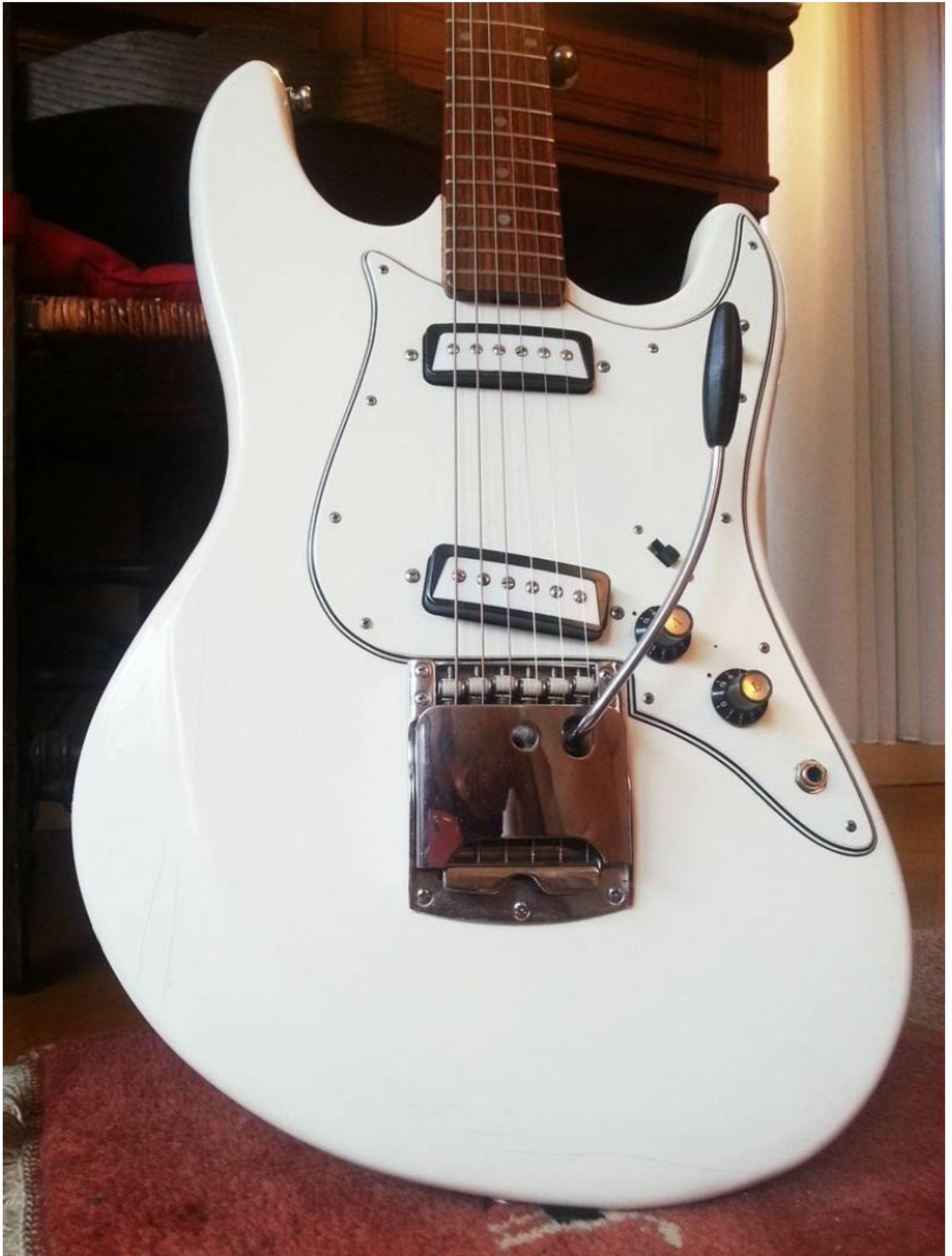
Guitare Ariat 1802T, vue générale