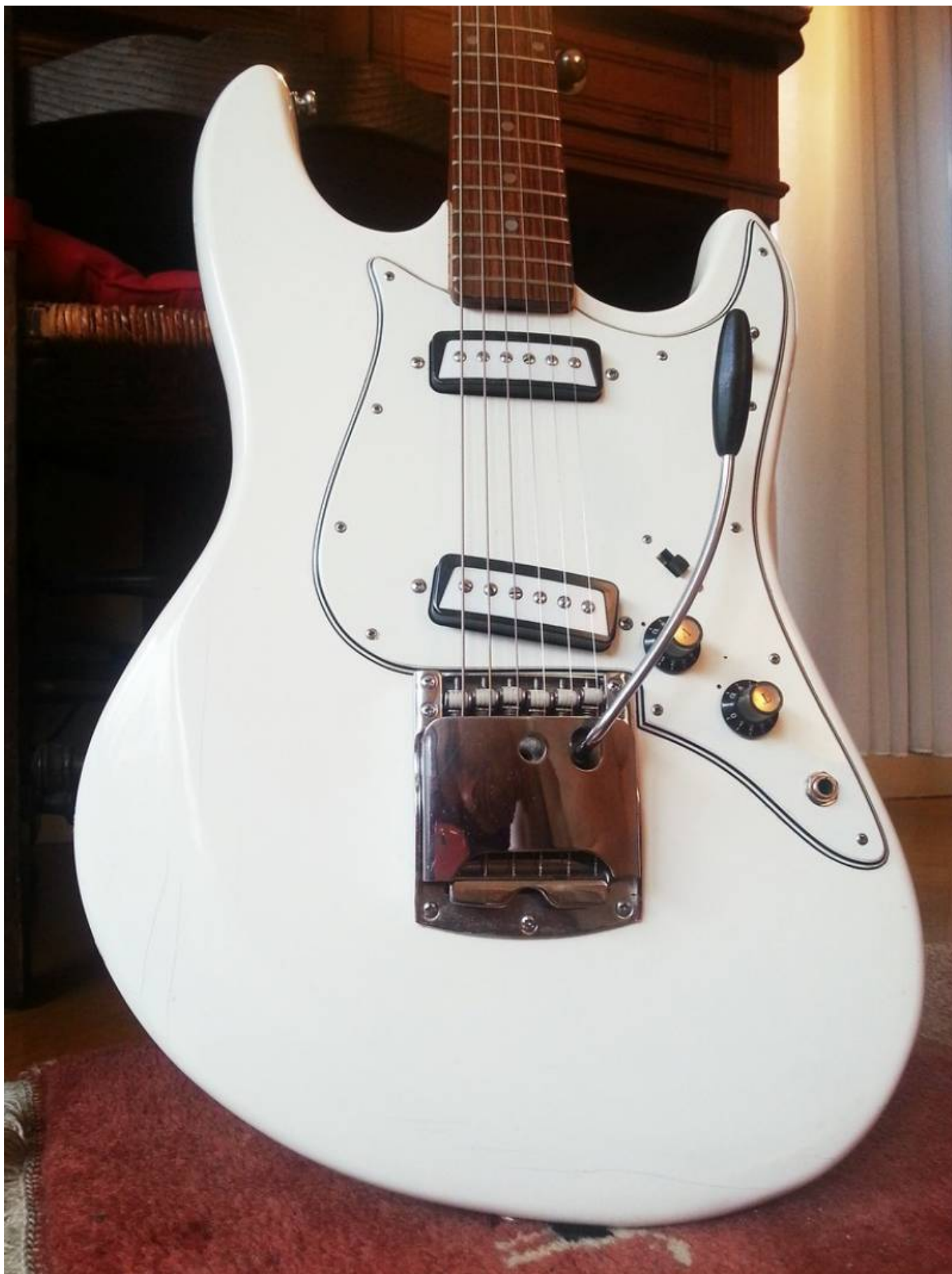
Guitare Ariat 1802T, vue générale