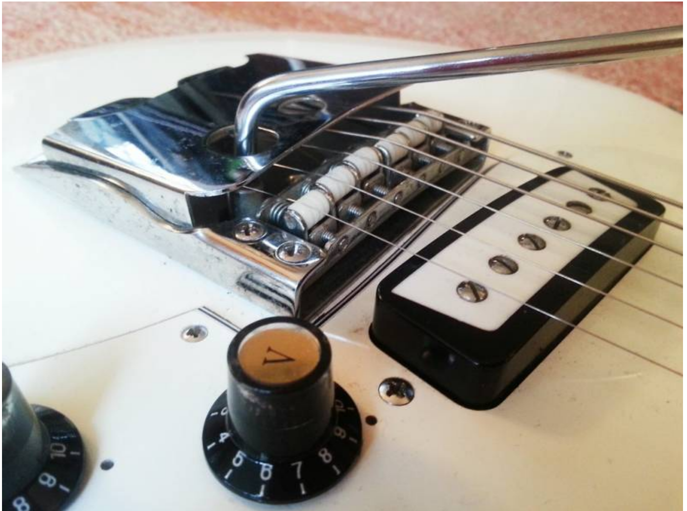
Guitare Aria 1802T, gros plan sur le système de trémolo

La guitare propose deux micros à simple bobinage, avec un look bien particulier, un système de trémolo avec un capot façon "cendrier" (qui fait penser aux telecasters, pour le coup), un potentiomètre de volume et un autre de tonalité, et ce tout petit switch noir à deux positions qui ajoute un gros plus à l'instrument. Il permet en effet de changer l'organisation du circuit électrique des micros, pour booster leurs sonorités. Du coup, on passe de sons typés stratocaster à des sons qui se rapprochent plus des micros humbuckers des Gibson.