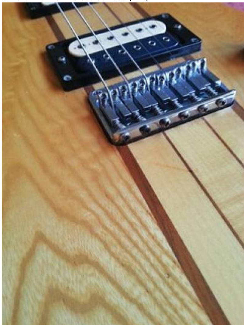
Guitare Aria Pro II TS-600 de 1980 (détail de la table)