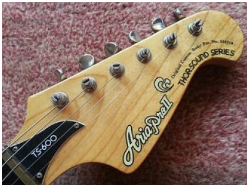
Guitare Aria Pro II TS-600 de 1980 (tête)