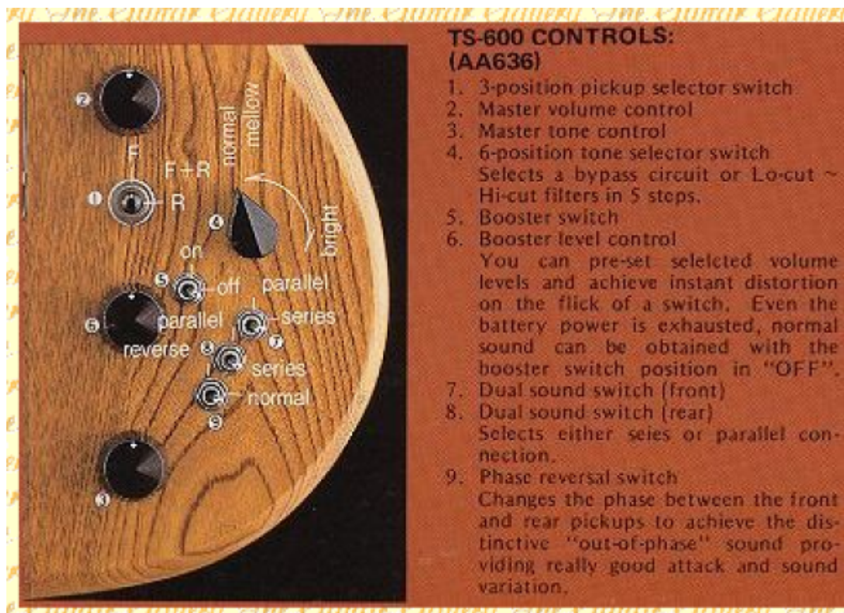
Extrait d'un catalogue Aria Pro II des années 1970 1/2

Une fois passé l'impact esthétique, le deuxième choc vient de l'électronique : on s'aperçoit vite qu'il y a un nombre assez déraisonnable de boutons et de switches. Les catalogues de l'époque permettent d'y voir plus clair.