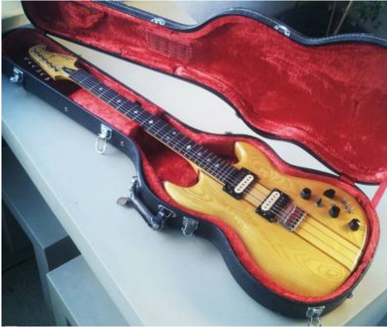
Guitare Aria Pro II ThorSound 600 de 1980

Le numéro de série est 004036, ce qui suggère une fabrication en 1980 (les deux premiers chiffres sont supposés être l'année).