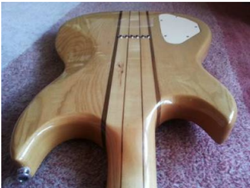
Guitare Aria Pro II TS-600 de 1980 (manche traversant)

Les micros sont des humbuckers Protomatic-III, les micros maison de Matsumoku, au son bien typé, puissant et chaleureux sans être trop sombre, ils excellent dans les saturations mais sont aussi très bons pour des colorations blues dans les sons clairs. Le chevalet permet une intention précise de chaque corde, et le sillet de tête est en laiton, ce qui assure une bien meilleure résonance qu'avec un sillet en plastique.