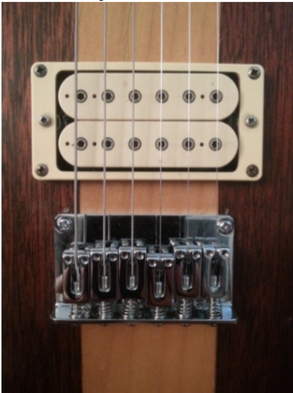
... et le nouveau chevalet, plus stable