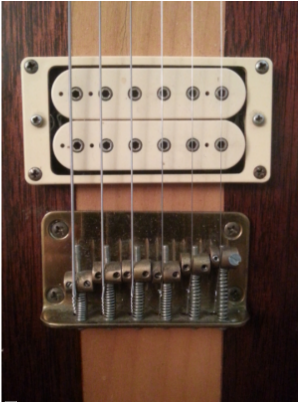
Le chevalet d'origine...