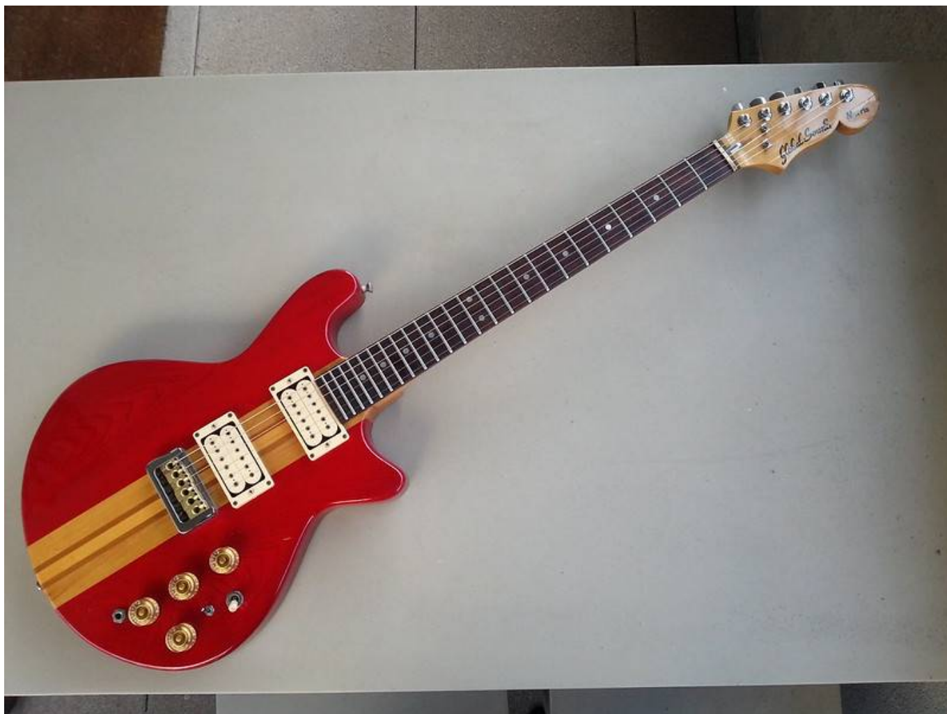
Guitare Morris Global Sound de 1984, vue générale

Acquise fin janvier 2013, Cette guitare électrique japonaise date vraisemblablement de 1984 (d'après le numéro de série), et elle est en excellent état général. La tête a un look bien particulier, facilement reconnaissable. J'ai juste eu à abaisser un peu le micro manche dans sa cavité pour avoir plus de clarté dans les notes graves en haut du manche. A part ça, nickel.