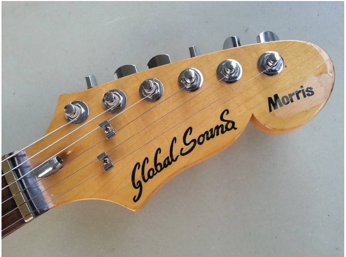
Guitare Morris Global Sound de 1984, gros plan sur la tête