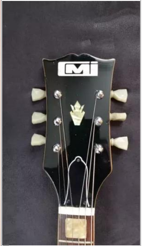
La tête d'une CMI SG avec son logo.