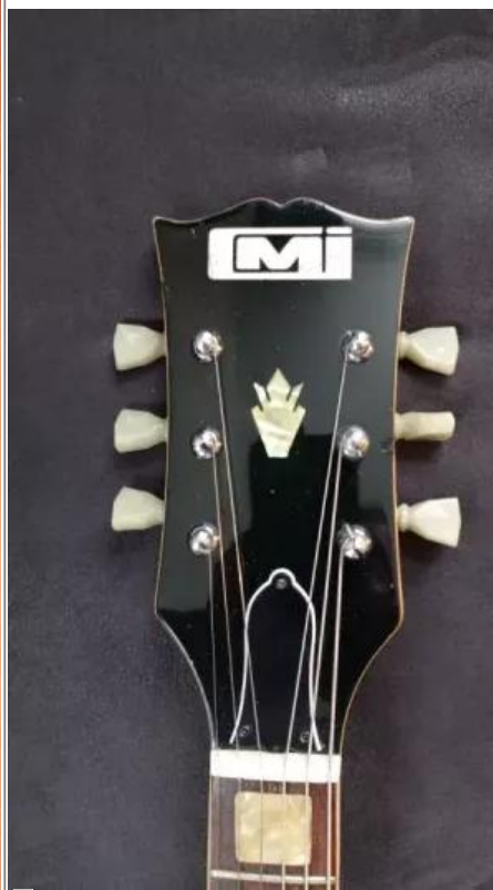
La tête d'une CMI SG avec son logo.