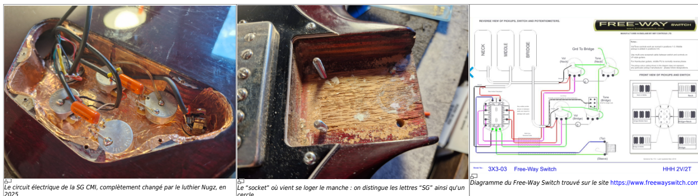
Le circuit électrique de la SG CMI, complètement changé par le luthier Nugz, en 2025

A cette occasion je découvre que le sélecteur si particulier, avec 6 positions, est fabriqué en Angleterre par NFS Controls LTD, c'est le modèle Free-Way Switch qui a son propre site web, https://www.freewayswitch.com