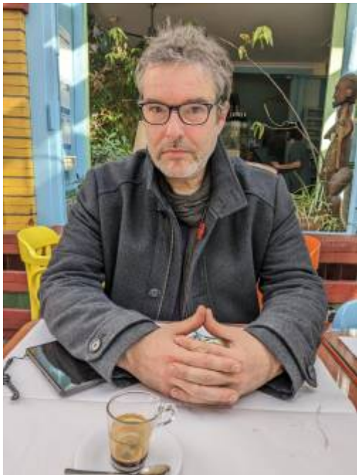
Photo prise dans un café de Montmartre, à Paris, en février 2023.