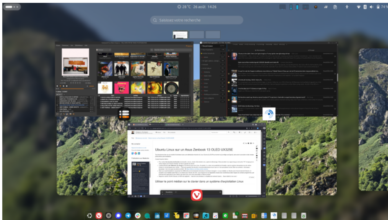
Capture d'écran d'Ubuntu 25.04 sur l'Asus Zenbook 13 OLED, montrant l'environnement de bureau Gnome avec 3 fenêtres ouvertes sur le premier bureau.

Tout fonctionne bien sur ce modèle d'ordinateur avec une distribution récente de Linux Ubuntu (la 25.04 au moment où je rédige ces lignes), sans avoir à procéder à des manipulations particulières post-installation.