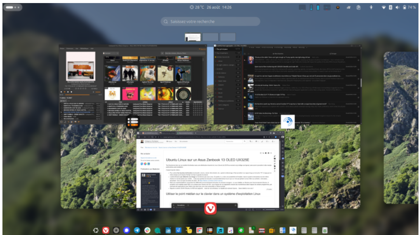
Capture d'écran d'Ubuntu 25.04 sur l'Asus Zenbook 13 OLED, montrant l'environnement de bureau Gnome avec 3 fenêtres ouvertes sur le premier bureau.

Tout fonctionne bien sur ce modèle d'ordinateur avec une distribution récente de Linux Ubuntu (la 25.04 au moment où je rédige ces lignes), sans avoir à procéder à des manip particulières post-installation.